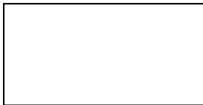
Схема границы эксплуатационной ответственности

Организация водопроводно- канализационного хозяйства